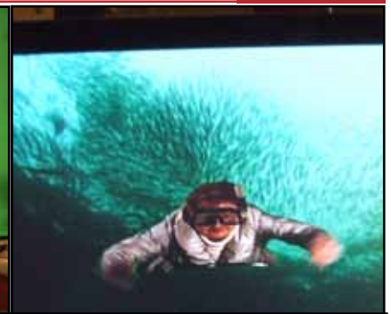
▲ 18.11. ekskursija uz Jaunpili, Cinevillu un Salmu darbnīcu. ▼