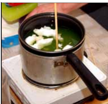
▲ Parafīna kausēšana sveču liešanai.