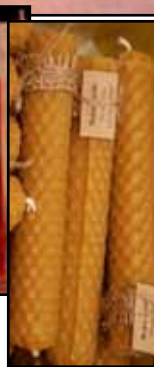
▲ Gan Talcē, gan SC, dāmas S. Erba pavadībā mācījās liet parafīna un tīt vaska sveces ▼