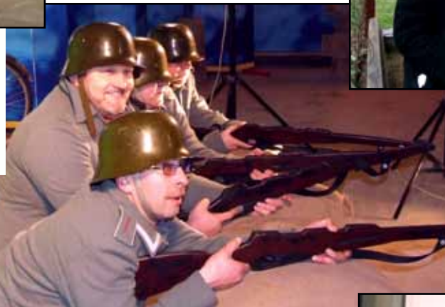
Organizatoriem un pašiem ekskursantiem ir neizpratne par to, kāpēc ir tik maza atsaucība SC grupas rīkotajiem ārpusdarba pasākumiem?!?!